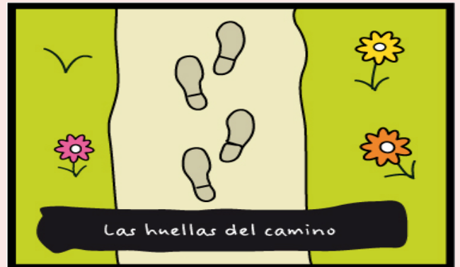
Dibujo final con el lema