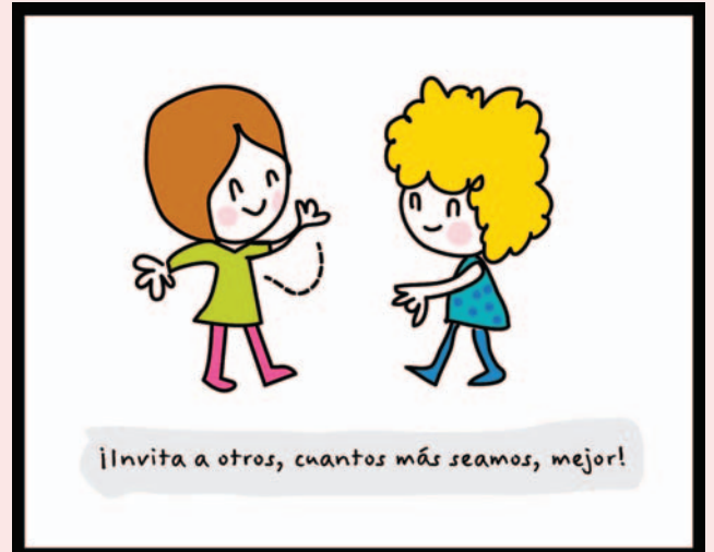
Dibujo final con el lema