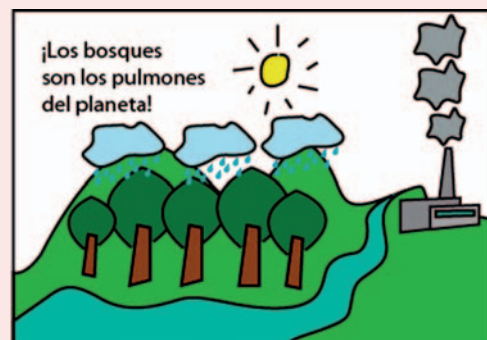
Dibujo final con el lema