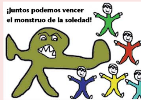
Dibujo final con el lema